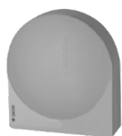
Accessorio obbligatorio sonda esterna

Grazie ad una elettronica di ultima generazione e alle funzioni evolute è possibile configurare il funzionamento del gruppo termico alle effettive esigenze dell'utente. Utilizzando la sonda esterna dedicata si ottiene un funzionamento in termoregolazione climatica durante il quale la temperatura di mandata all'impianto si regola in funzione della temperatura esterna garantendo un comfort assoluto ottimizzando i costi di gestione. L'elettronica consente di impostare fino a 3 set-point di temperatura consentendo la riduzione notturna con possibilità di programmazione giornaliera.